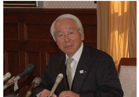
平成24年度予算案を発表する井戸知事