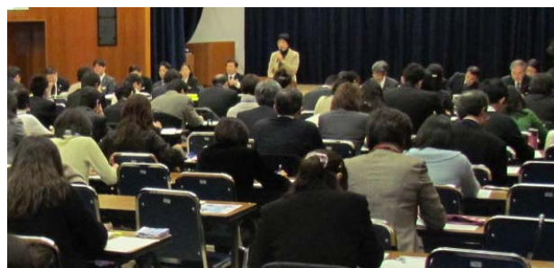
各市町の事例発表

県内5市町による先進的な少子対策の取組事例発表や、県関係課による24年度の施策説明が行われた後、分野別グループ討議を行い、県・市町の情報共有を図りました。