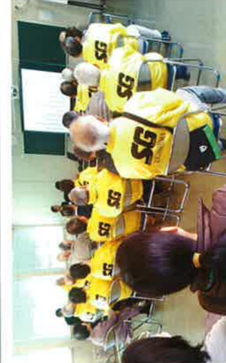
小コミ研修室で練習中