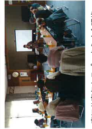
東江井青年クラブ・きらら会研修

江井島地区人権教育研究協議会(略称:江井島地人協)は、学校園、自治会、PTA、企業を中心に構成され、すべての人の基本的人権が尊重されるまちづくりを目指し、様々な人権問題の研究・啓発活動を行っています。自治会・各種団体等で