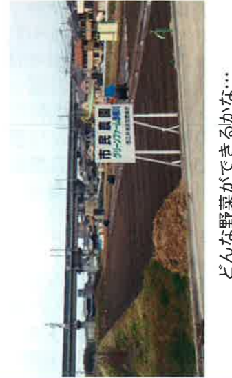
どんな野菜ができるかな...