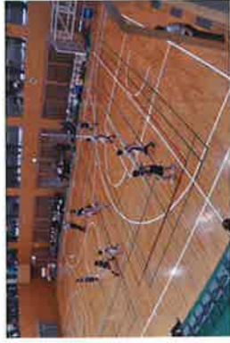
一生懸命走ったね！

第22回能田杯争奪東播磨ミニバスケットボール新人大会男子の部が2月15日(土)23日(日)滝野スカイピニアにて開催されました。東播磨各地区から参加した16チーム中、江井島ミニバスケットボールクラブが優勝しました。 予選1加古川戦 14-7 予選2松が丘戦 22-11 準決勝上荘戦 11-9 決勝大久保南戦 14-9 一生懸命走ったね！