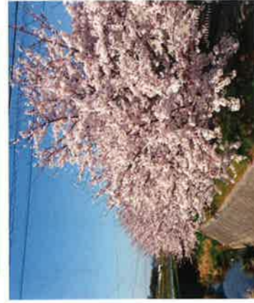
昨年春の赤根川沿い