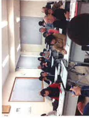
朝来市山東町与布土にて

「天空の城」竹田城や生野銀山で有名な朝来市。ここでも深刻な人口減少と少子高齢化は大きな課題であり、市内の山東町与布土地区では、地元住民が自らの力で活性化に取り組んでいます。組織作り等を学ぶためにコミュニティ推進協議会から19名が与布土へ行ってきました。 午前中に2時間みっちり研修・意見交換。昼食をとった百姓茶屋「喜古里」は、古民家を再生した地産地消のレストランで、地元の人達が経営しています。