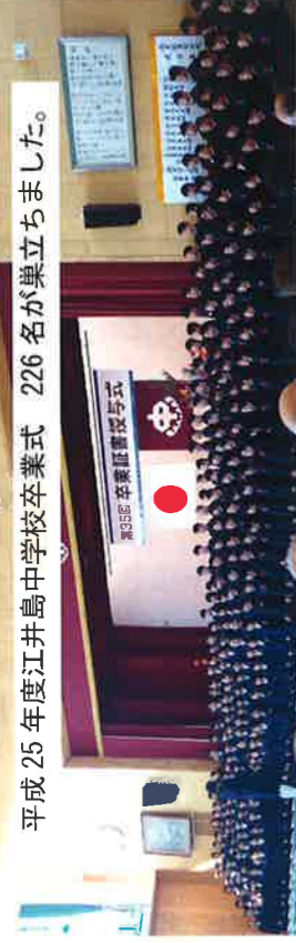
平成25年度江井島中学校卒業式 226名が巣立ちました。