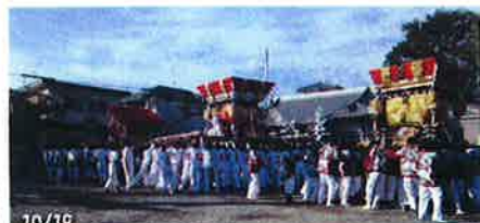
10/19 西江井・東嶋・東江井 勇壮な布団太鼓3基の屋台練り