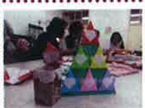
喫茶 9:30~11:30・14:00~16:00 ※年末年始休み 喫茶 12/24(水)~1/7(水) 夢文庫 12/26(金)~1/9(金)

ふれあい喫茶「折り紙」 小学校「コメン」で毎週水曜日開催のふれあい喫茶、午後の部で折り紙の教え合いをしています。いつでもお立ち寄りください。