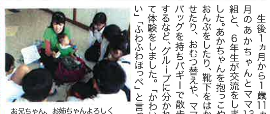
お兄ちゃん、お姉ちゃんよろしく

森ソフト健闘する 子どもの自殺やいじめを防止とNPO法人「ママの働き方応援隊・神戸西校」のメンバーが道徳授業の一環として江井島小学校を訪れました。