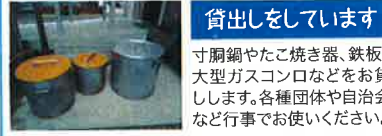
貸出しをしています 寸胴鍋やたこ焼き器、鉄板、大型ガスコンロなどをお貸しします。各種団体や自治会など行事でお使いください。詳しくは小学校コメンへお問い合わせください。

てふれあいながら、育児の話に興味津々で聞き、命の大切さを学びました。 基が開祖と言われる極楽寺や、校歌に歌われる明治4年、江井島小学校発祥の長楽寺、酒蔵や酒造りによる、普段は毎日ウォーキングして通っている人も見落としていたり、内部にお邪魔するチャレンスのない場所をいろいろ見せて頂きました。最後に少年自然の家で、「えいがしま鍋」に心身ほっこり、やさしい味噌汁立ての今日の鍋の身は、地元の海で獲れた蛸、穴子、畑で採れたサツマイモ、人参、大根など。本来、中身は問いませんが、地産地消の素材に、最後の決め手は愛情いっぱい!!