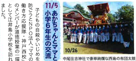
10/26 中尾住吉神社で豪華絢爛な西島の布団太鼓