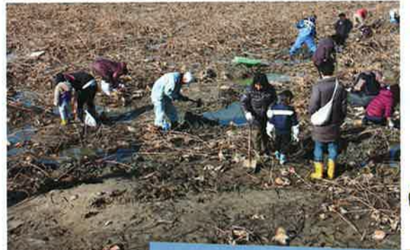
一年に一度ため池に突入!

家族連れや青年・女性グループなど340人の参加者があり、長靴、スコップの勇ましい姿で長さを競うレンコン掘り。長尺の結果もさることながら、老若男女が池の泥と格闘。揚げたて「レンコンてんぷら」は大好評で600個を完食。景品のお米や海苔など関係者の皆様のご協力で大歓声が響くため池でした。年々、住民の皆さんの参加も増え、年の瀬の江井島の風物詩となっています。