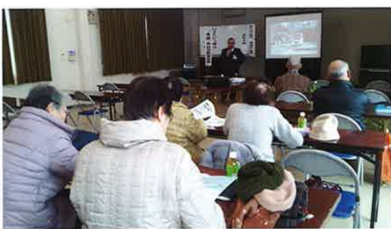
救急の医療を学ぶ

今回のテーマは「いざいざ」の夜の夜間・休日の医療体制について、西江井自治会館で行いました。今後毎月ごと東西一か所ずつに会場を設けて、生活に役立つ情報を発信していきます。次回は2月26日(木)午後1時30分から西島地区コミュニティ会館で開催いたします。是非ともご参加ください。(川原)