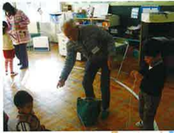
▲おじいちゃんのかま回しすぞい!

江井島幼稚園、小学校、中学校が、避難訓練と引渡し訓練を行いました。幼稚園では、地震発生時の緊急放送のあと、防災頭巾をかぶって先生の周りに集まり、そのあと全員が大保育室に集まりました。