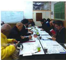
江井島への熱い思いを議論

当計画は、住民の自主的な運営による、まちづくりプロジェクト会議や各部会で協議し、本年度中の完成をめどに取組んでいます。各部会においての現在の協議事項をお伝えしています。これからの議論により、変わることもあることをご理解ください。また、いずれの会合も自由にご出席ができますのでお越しください。