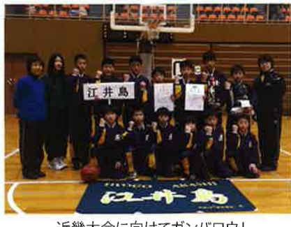
近畿大会に向けてガンバろう!

SC21江井島のミニバスケットボールチームが、12/27・28日全国近畿予選で3位になり3/7・8日の近畿大会へ進出することになりました。また、1/17・18日に行われた兵庫県選手権大会では2位になり、実力が確実なものとなっています。(三代)