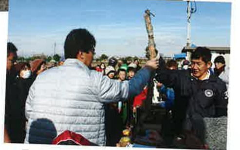
長いレンコン、最高は107cm!