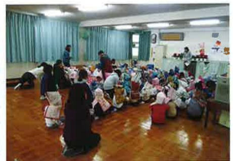
いざいざの時に役立つ防災頭布

好天に恵まれ、明石陸上競技場で、駅伝とタイムトライアルが開催されました。本校の子どもたち140名余りが大活躍しました。駅伝の部では、男子がアンカーで競り勝ち、優勝。女子では、優勝常連校に迫る二位。さらに、トライアルでは自分の記録を一秒でもあげようと、寒風に立ち向かいました。子どもたちから「チャレンジ」する素晴らしさを教えられました。(小学校 濱田)