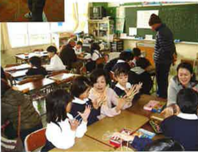
おばあちゃんのおあ取り上手!

好天に恵まれ、明石陸上競技場で、駅伝とタイムトライアルが開催されました。本校の子どもたち140名余りが大活躍しました。駅伝の部では、男子がアンカーで競り勝ち、優勝。女子では、優勝常連校に迫る二位。さらに、トライアルでは自分の記録を一秒でもあげようと、寒風に立ち向かいました。子どもたちから「チャレンジ」する素晴らしさを教えられました。(小学校 濱田)