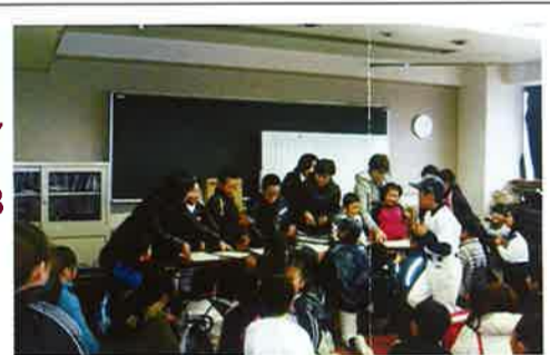
大好評!クリスマス会「絵合わせゲーム」

122名の子どもたちが大好きな事を描いた、世界に一つだけの夢の木ノキホルダー作りやお菓子・ジュースタイム、そして、単位子ども会対抗「絵合わせゲーム」大会を行いました。子どもたちのたくさん笑顔に、元気といたがりました。ご協力いただいた皆さま、ありがとうございました。