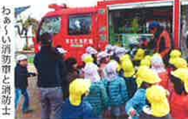
津波が来たときは長靴ではなく、スニーカーがいい わぁぁい消防車と消防士さんが来たよ