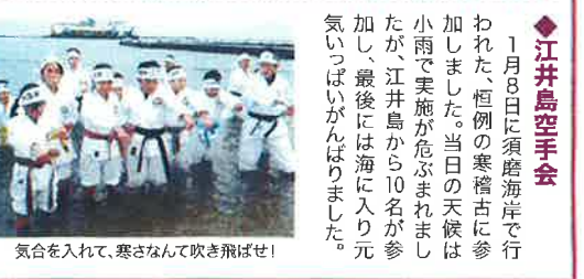
あかし市民広場で形を披露

70チーム出場中、江井島チームは男子総合・女子総合とも第3位に入賞しました。2秒でも速く1歩でも速くへ目標を掲げ、2ヶ月間の練習の成果を発揮しました。学校通信1月31日発行の「あかねがわ」に子どもたちのがんばりが詳しく紹介されています。