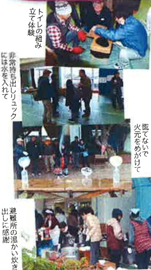
トアの組み立て体験 非常持ち出しリュックには水を入れています

初めての取り組みで、準備不足もあり、多くの課題を見つける機会になり、次年度へ繋げることができました。