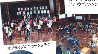
サプライズのフラッシュモグ