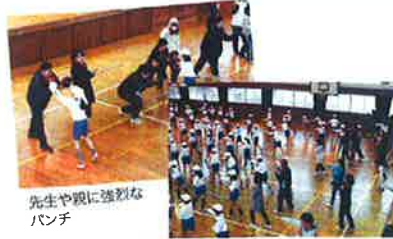
先生や親に強烈なパンチ