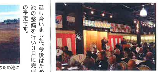
話し合いました。今後はため池の整備を行い3月に完成の予定です。

1/7 新年交歓会 新年をお祝いする、恒例の江井島校区の新年交歓会が107名の出席で華やかな雰囲気で行われました。大西会長より今年の漢字「動」が披露され、日々の感動は元気の源であり、新年度から新たなまちづくりの推進へ大きく舵を動かしたいと強い意気込みで述べられました。